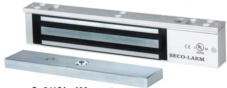
E - 941SA - 600 muestra